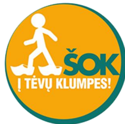
1 pav. Iniciatyvos „Šok į tėvų klumpes“ logotipas.

Iniciatyvą „Šok į tėvų klumpes“ Lietuvos mokinių neformaliojo švietimo centro Ugdymo karjerai skyrius organizuoja kiekvienais metais. Šiomet dėl epidemijos ir karantino apribojimų veikla įgavo papildomų niuansų: kadangi mokiniai negalėjo vykti į tėvų darbovietes, buvo nuspręsta iniciatyvą organizuoti nuotoliniu būdu. Vyko virtualios ekskursijos tėvų/globėjų/kitų artimųjų darbovietėse, profesijų ypatumai buvo nagrinėjami virtualiuose interviu.